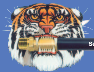
Servis hadic u zákazníka